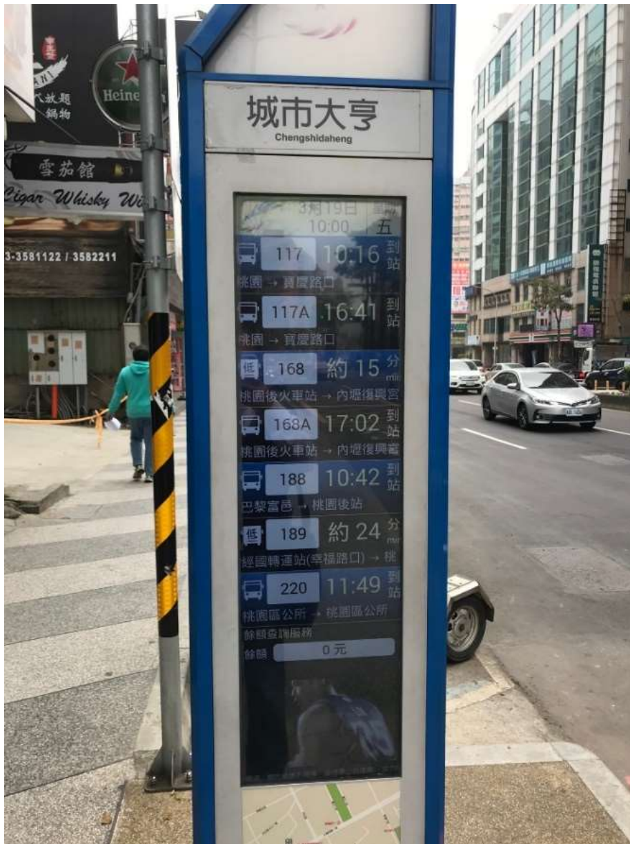
( 下車地點站牌 )