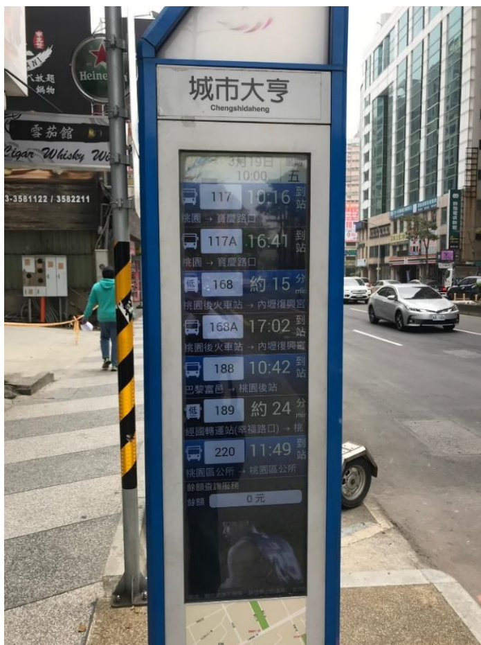
( 下車地點站牌 )